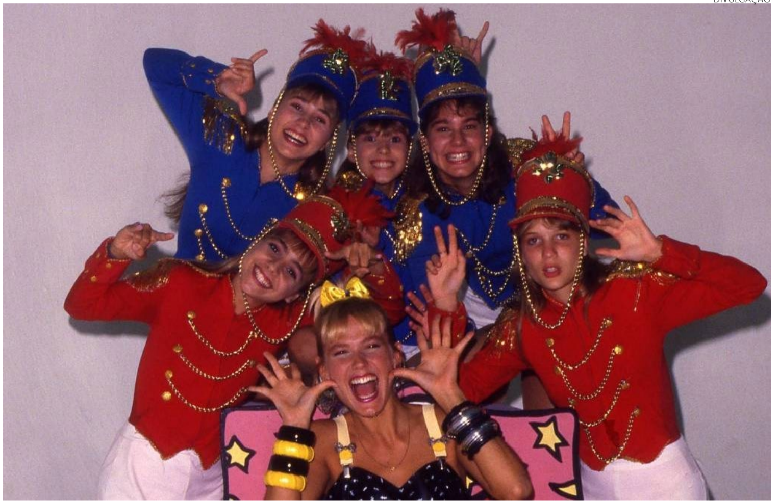
Xuxa ao centro: Paquitas ajudaram apresentadora domar crianças espalhadas pelo palco em programas de TV

As meninas bonitas, loiras e de shortinhos curtos no começo apenas ajudavam Xuxa na trabalhosa tarefa de domar as várias crianças espalhadas pelo palco. Com o tempo, foram se tornando elas também figuras queridas pelo público, lançando-se como uma atração à parte do “Xou da Xuxa”. Gravaram discos, estrearam filmes e viraram