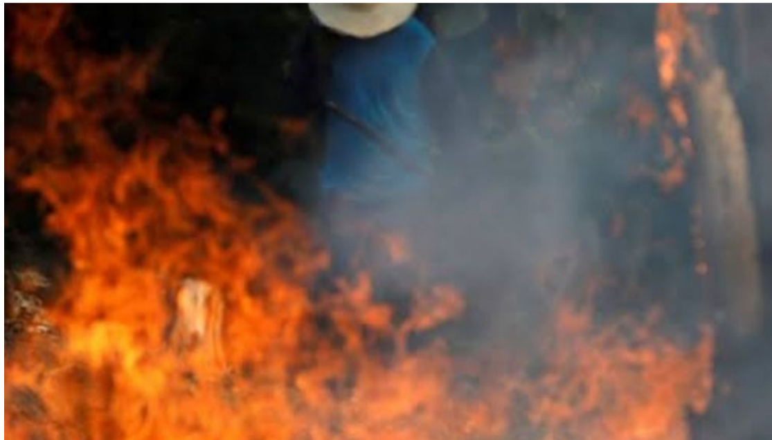
Queimadas trazem situação de risco para mais vulneráveis: incêndios se espalham nos Estados

Ministério da Saúde e médicos alertam população que combinação de cenários traz riscos para vida das pessoas. Fumaça leva a quadros de doença respiratória