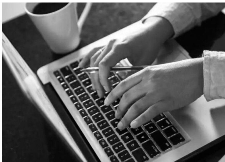
Uso em demasia das plataformas online pode estar relacionado aos transtornos mentais como depressão e ansiedade

A psicóloga orienta os interessados a buscarem fontes confiáveis, como a Organização Mundial da Saúde (OMS), a Associação Brasileira de Prevenção ao Suicídio, a Associação Brasileira de Sobreviventes Enlutados por Suicídio e o próprio Instituto Vita Alere.