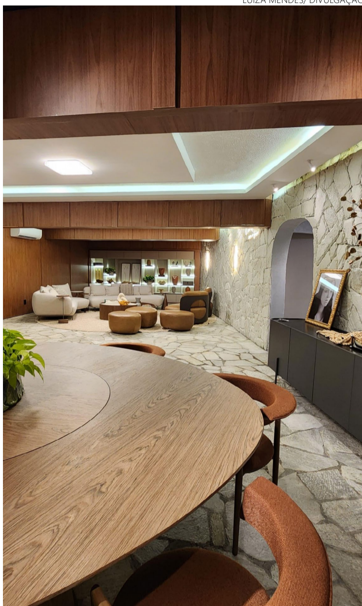
Ambiente combina materiais nobres com tecnologias de automação

O ambiente combina materiais nobres, como madeira, mármore e outros, com as mais recentes tecnologias de auto-