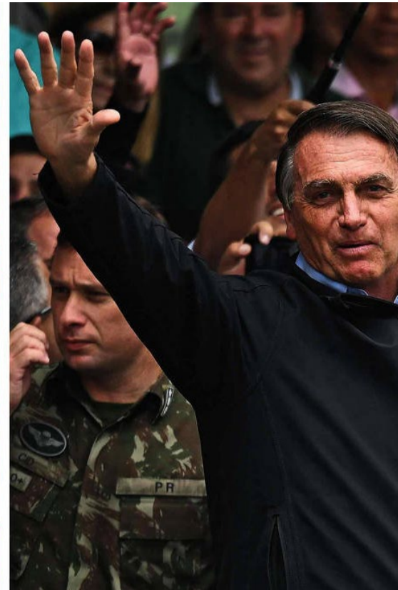
Lula da Silva e Jair Bolsonaro: Justiça Eleitoral avalia o uso de imagens dos políticos