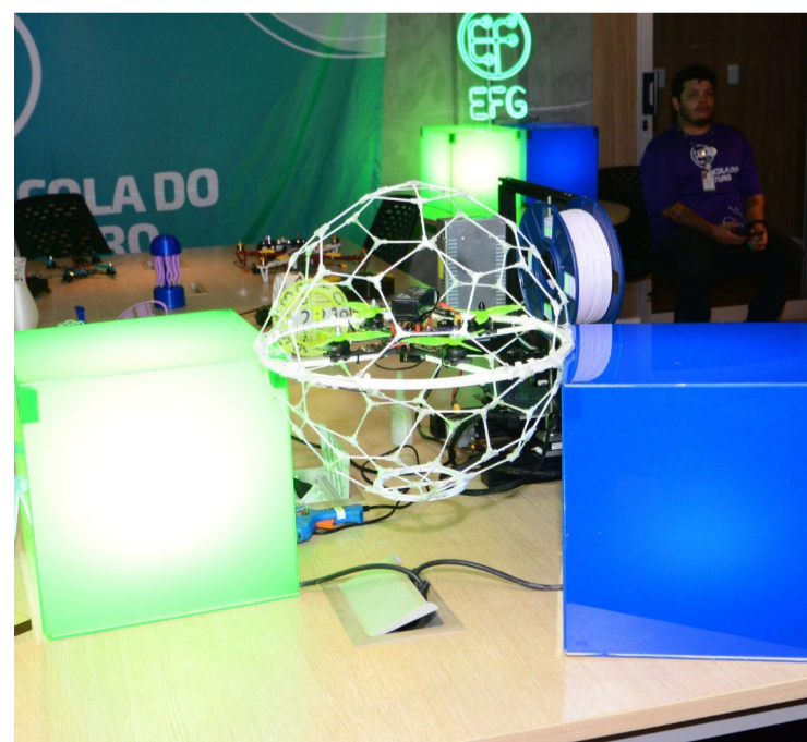
Futebol de drone será também um dos destaques da Campus Party, em novembro

Uma equipe de 20 pessoas, entre professores, técnicos e estudantes da escola, dedica tempo para pesquisa, testes e treinos para o campeonato. Essa equipe desenvolve os drones dentro dos laboratórios da escola, que contam com impressoras 3D, equipamentos de robótica e cursos de programação, conferindo a estas máquinas voadoras toda a robustez necessária para jogar, pois o drone ocupa o lugar da bola neste campeonato.