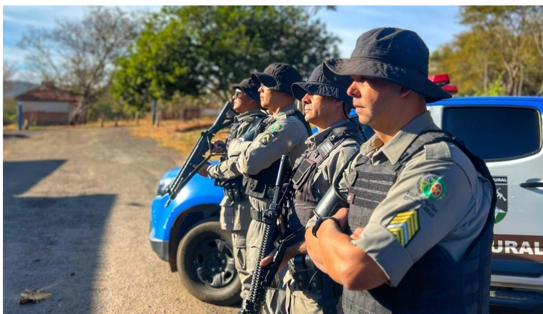
Batalhão de Polícia Militar Rural em Goiás: PMGO busca redução de ocorrências nas cidades do interior goiano

Em seu Relatório Institucional, o Batalhão de Polícia Militar Rural, recém divulgado, diz que nos últimos 12 meses, conseguiu uma redução significativa nos índices de criminalidade: - Furtos e Roubos: queda de mais de 10%. - Homicídios: