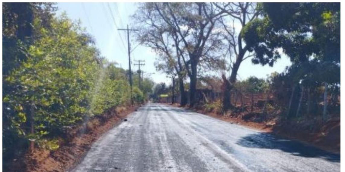
Equipes fizeram a imprimação das Estradas 100 e 109 neste final de semana

Estão sendo implantadas dez redes de drenagem, com tubulações que variam de 400 a 1.500 milímetros de diâmetro. A prefeitura está investindo R$ 31,5 milhões em infraestrutura, com quase 20 quilômetros de tubulação, que passam pelas Estradas 100, 102, 103, 104, 105, 106, 107, 108, 109, 110, 111, 113, 115, 117, 123, 131, 133, Rodovia GO-070 e Alameda Nova Esperança. Cerca de 55% da obra já está concluída.