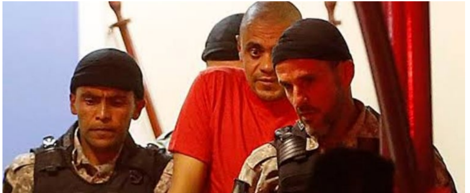
Adélio Bispo de Oliveira, autor do atentado contra Jair Bolsonaro (PL), está em cela comum com outros presos: Defensoria Pública tenta sua transferência