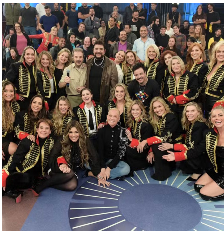
Programa “Altas Horas”: encontro marca lançamento de doc