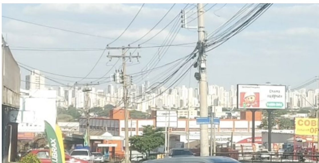
Goiânia enfrenta dias ainda mais quentes a partir desta segunda-feira

Todos podem sofrer os efeitos do tempo seco, especialmente os idosos. Por isso, a indicação é de as pessoas abusarem da hidratação e evitarem ficar expostos diretamente ao sol entre 11h e 16h.