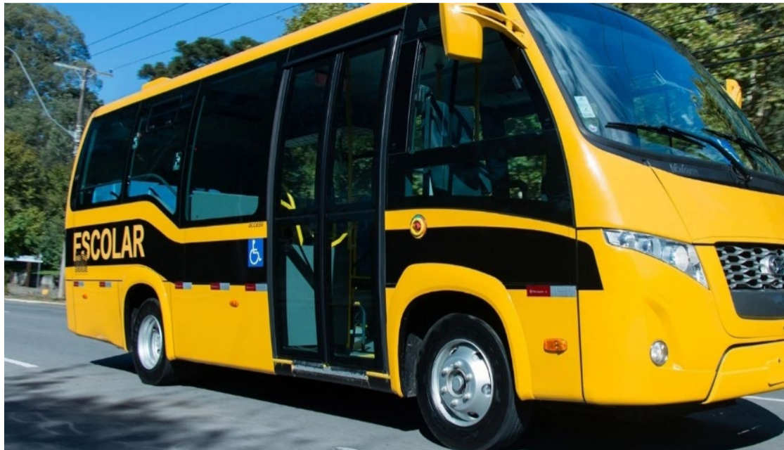
Interessados devem procurar unidade do Atende Fácil e realizar a solicitação de abertura de cadastro

Apesar dessa alteração realizada por meio da portaria 52, de 6 de setembro de 2024, os trabalhadores do setor de-